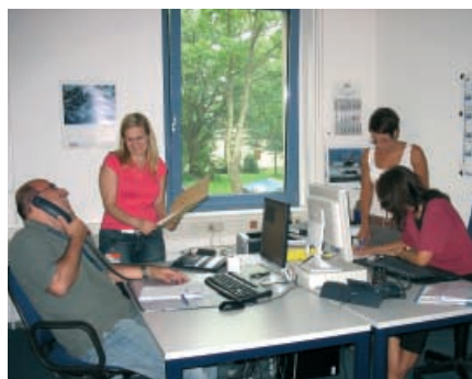
Immer für Sie im Einsatz – das Team von AirIT.

Wir haben für unsere Kunden die Servicezeiten verlängert und sind nun täglich eine Stunde früher für Sie erreichbar. Bereits ab 7:00 Uhr hilft unsere ServiceLine bei Fragen und Problemen, nimmt Störungen auf und leitet diese bei Bedarf weiter an unsere Fachtechniker. Auch unsere Techniker sind nun ab 7:00 Uhr für Sie im Einsatz.