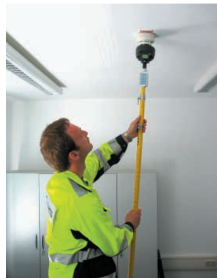
Prüfung der Brandmelder

In diesem Monat erfolgte nun abschließend die Zertifizierung nach DIN 14675 durch einen lizenzierten Auditor, der uns damit die Einhaltung der im QM festgelegten Prozesse bescheinigt. Wir bieten unseren Kunden somit einmal